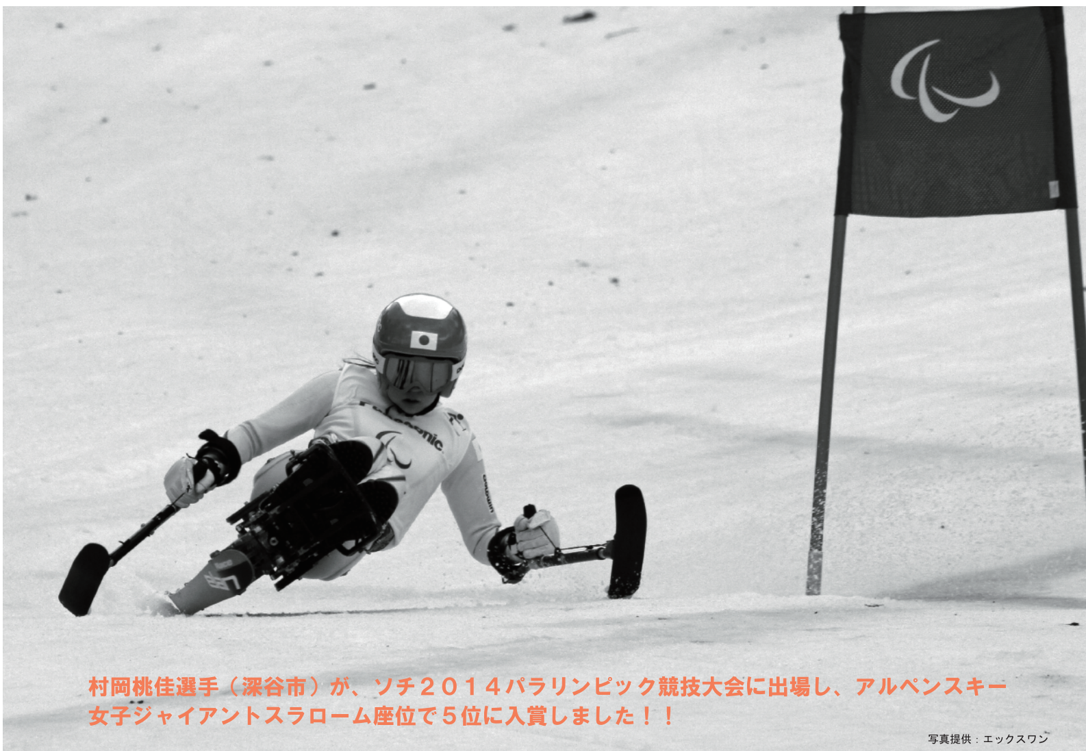
村岡桃佳選手（深谷市）が、ソチ2014パラリンピック競技大会に出場し、アルペンスキー女子ジャイアントスラローム座位で5位に入賞しました！！