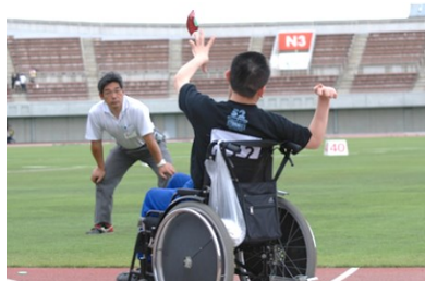
りくじょうきろくかい 陸上記録会