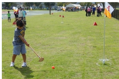
グラウンド・ゴルフ