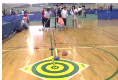
スポーツいろいろ体験 たいけん