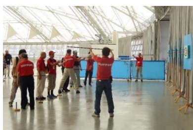
ふきや スポーツ吹矢