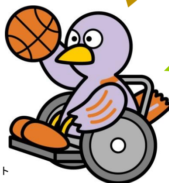
埼玉県のマスコット 「コバトン」