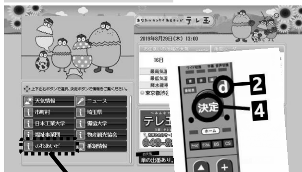
テレ玉データ放送トップ画面