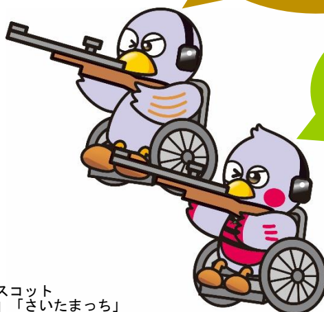
埼玉県のマスコット 「ゴバトン」「さいたまっち」