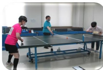
サウンドテーブルテニス