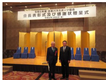
←埼玉県ソフトボール協会 県北支部