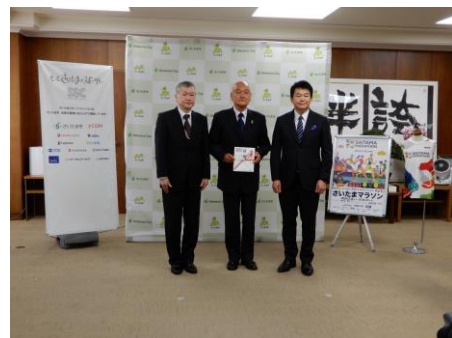
さいたまマラソン主催者 様 贈呈式