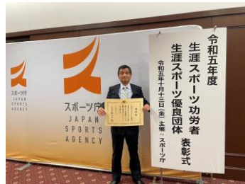
←埼玉県障がい者バスケットボール連盟