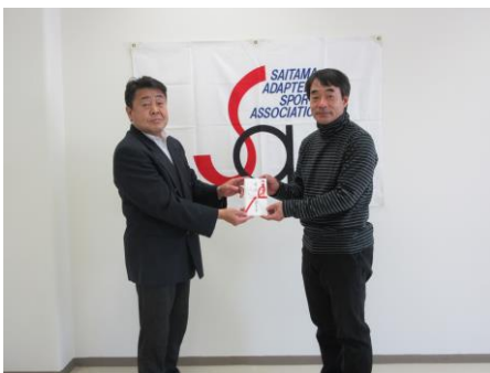
豪友会 様 贈呈式

皆様から頂きました寄付金は障がい者スポーツの普及・充実を図るために役立てていただきます 温かいご支援に感謝いたします